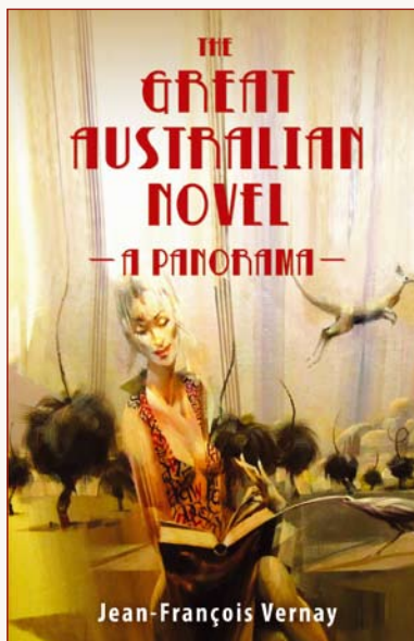
Couverture de l'édition anglaise.