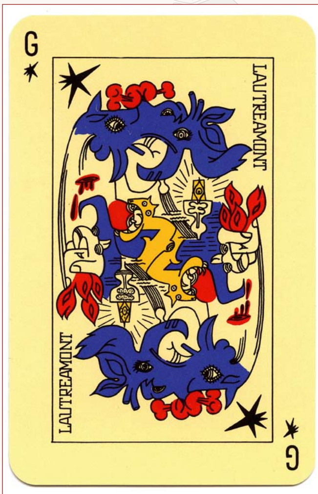
Carte de Wifredo Lam représentant Lautréamont, génie de la famille du Rêve, 1941.