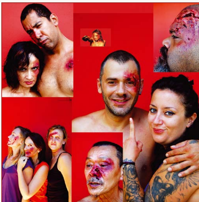
Série pour Ko Névâ (photomontage). D'après Thierry Mangin et Princess Saphira.

Cours et stages d'Arts Plastiques Enfants et Adultes