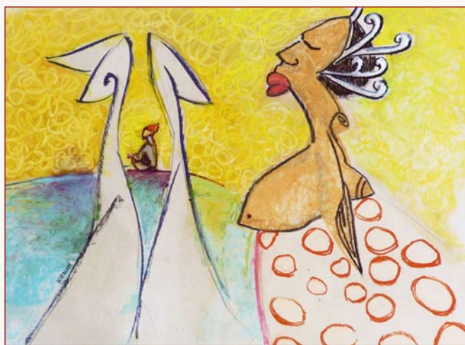
Hans Vergara, Sans titre. Pastel sur carton, 43 x 63, 2011.