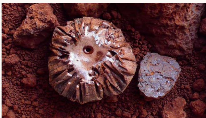
« Nodulea calédonien ». N° d'inventaire nc.yate.nopd005.jpbrasz.