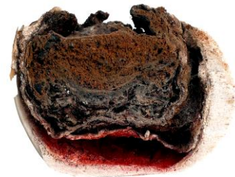
Nodulea pictorialis / ole.009-jpbrazs Ile d'Oléron, Charente-Maritime / France